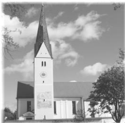
Mariä Reinigung & St. Wendelin Waidhofen